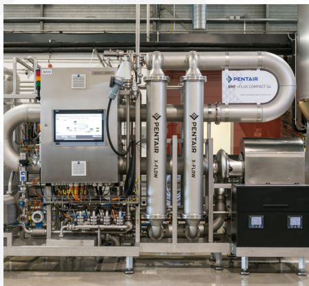
BMF +Flux Compact S4 – Kapazität 30-60 hl/h