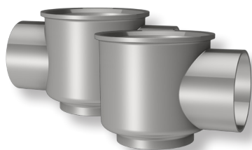
Gehäuse Eck- und Doppelleck